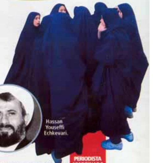
PERIODISTA APADRINADO POR QUO